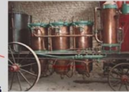
Distillerie de St Romain de Benet le 6 février