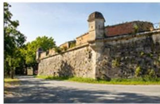
Citadelle de Brouage le 15 mai