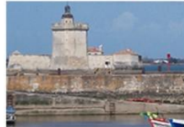
Fort Louvois le 10 avril