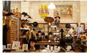
Musée des commerces d'autrefois de Rochefort le 6 janvier