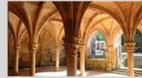
Abbaye de Fontduoue le 5 juin